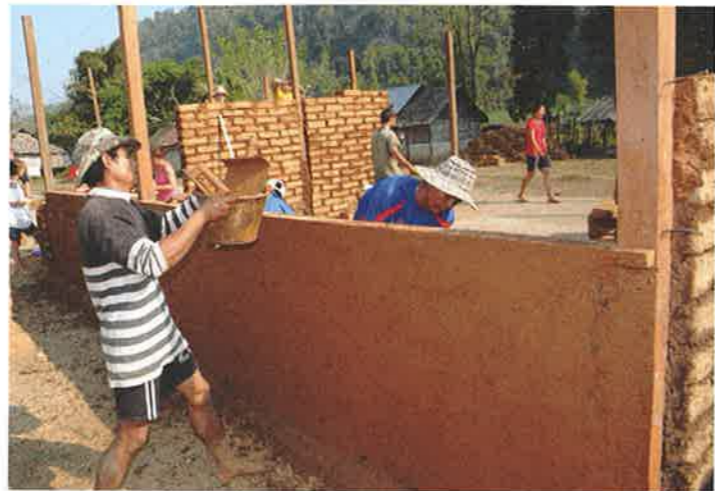
Adobestein danner tre av fire vegger i klasserommene. Den fjerde skal være bambus.

De første dagene går med til befarung av tomt, idékonkurranse og utarbeiding av skisser og modeller – nordmenn og karener blandes og skal finne måter å snakke sammen på. Ikke alle kan engelsk. Deretter